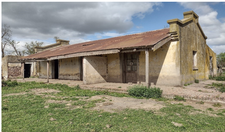
Imagen del posible edificio