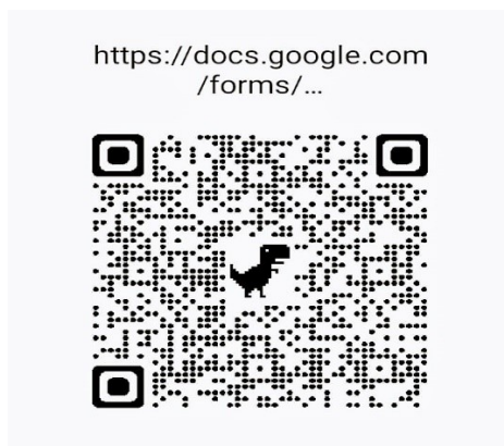
Qr compartido para dar difusión a la encuesta

Los materiales utilizados fueron dispositivos como celulares para la filmación de las entrevistas, el compartir las encuestas vía whatsapp y mediante código QR, planillas donde los vecinos firmaron, etc.