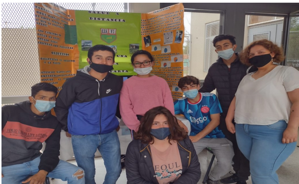
Presentación del proyecto en la Feria Regional de Educación, Arte, Ciencia y Tecnología

Aun así seguiremos luchando por conseguir nuestra sala de primeros auxilio por el bien de la comunidad educativa de la EESN°3 y de todos los habitantes de la zona. Dado que el derecho a la salud no puede ser restringido ni revocado.