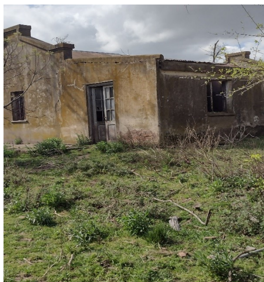
Otro ángulo del lugar

Una vez obtenidos la cantidad de encuestas esperada, se procedió al análisis de la factibilidad y viabilidad del proyecto.