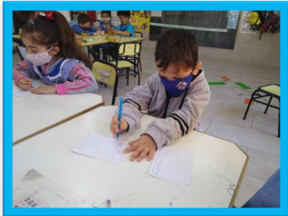
ESCRITURA POR SÍ MISMO