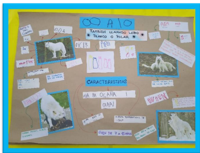
INFOGRAFIA LOBO ARTICO

Las infografías se expusieron en el SUM, donde se invitó a las familias a la “Feria de ciencias escolar”. Los niños comentaron los conocimientos adquiridos sobre los lobos.