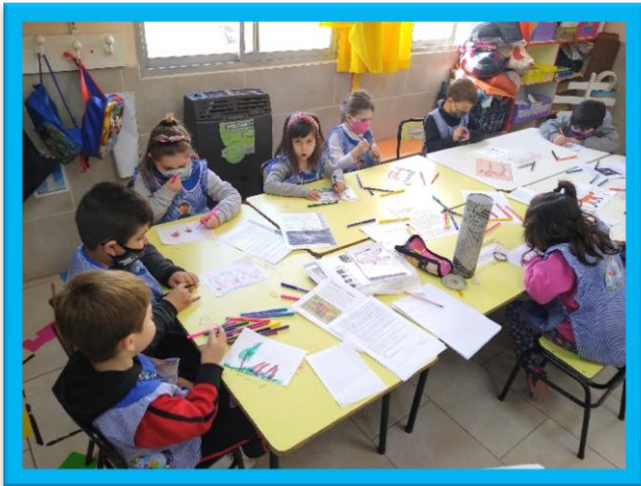
Registro grafico de lo investigado

5ª actividad: se dio lectura a textos informativos sobre como es el lugar donde viven, de que se alimentan y como consiguen su alimento esa especie de lobo. Se registró la información a través de escritura por sí mismo.