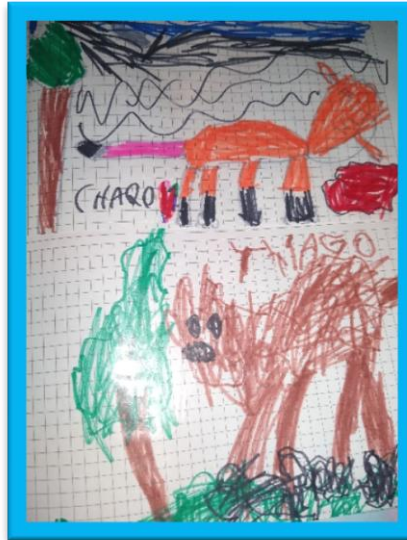
REGISTRO GRAFICO DE LOS VIDEOS

8ª actividad: se investigó en pequeños subgrupos con quienes viven los lobos, si tienen familia, como nacen, como cuidan a sus crías. Se realizó escritura por sí mismo y se expuso toda la información recabada al resto del grupo.