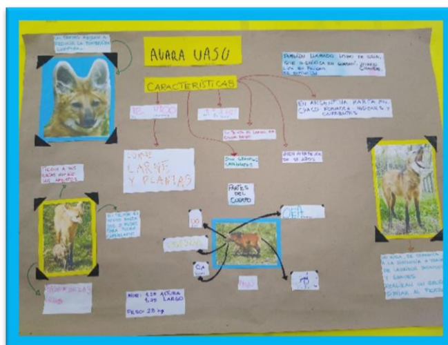
INFOGRAFIA LOBO AGUARA GUAZU